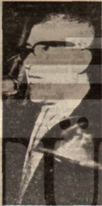
Dr. KEMAL SATIR «Güleğe ne söyledi?»

O günden bu yana köprülerin altında çok sular akmış, CHP,